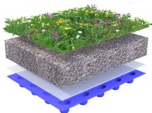
BIODIVERS GROENDAK 0-15° VERZADIGD GEWICHT: 220-225 KG/M 2