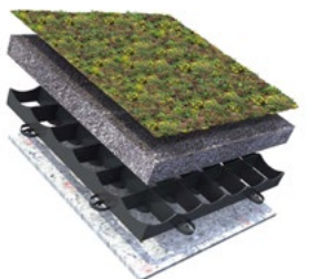
STERK HELLEND GROENDAK 25-45° VERZADIGD GEWICHT: 100-105 KG/M 2