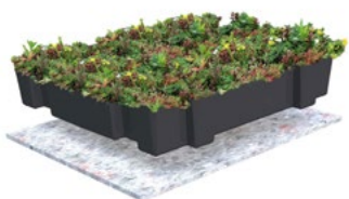
KANT-EN-KLARE SEDUMTRAY 0-15° VERZADIGD GEWICHT: 80 KG/M 2